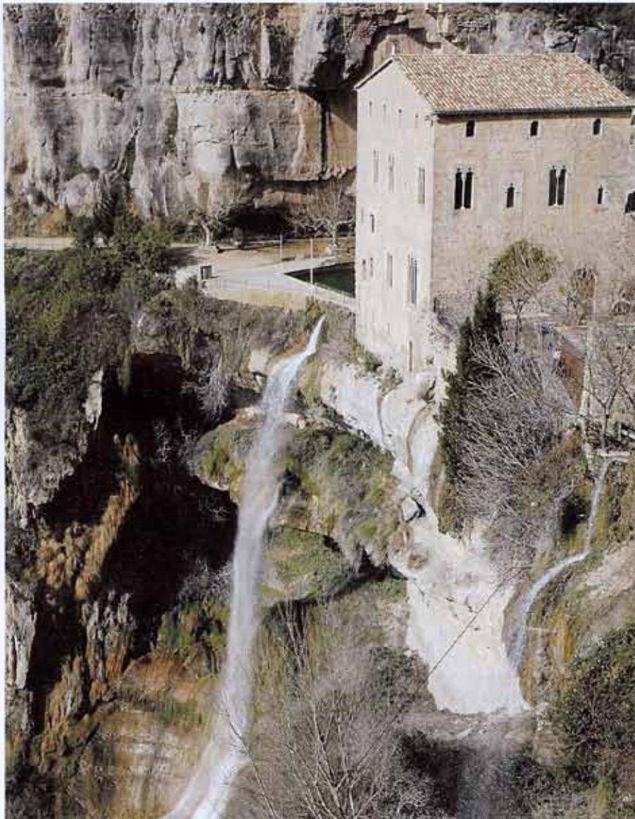
Víctor Balaguer a Una expedició a Sant Miquel del Fay : «Les roques ploren aigua; les herbes, perles.»

el lector hi trobarà a faltar autors i textos. Això serà un bon senyal, perquè voldrà dir que la gent s'ho ha llegit amb una especial estima i atenció.»