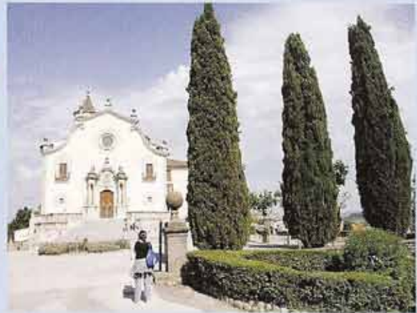
«Difícilment pot trobar-se estada més bonica i millor per un poeta, i sobretot per un poeta sacerdot i vigatà, que aquest santuari», opinava Jacint Verdaguer del santuari de la Gleva (Osona) a En defensa pròpia .