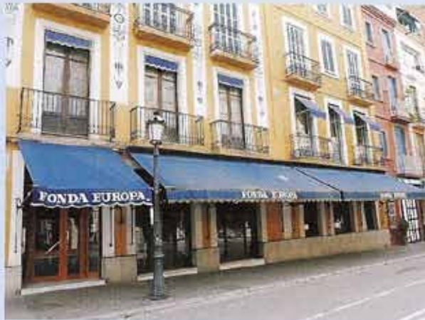
La Fonda Europa de Granollers, lloc de referència gastronòmica, ha sigut punt de trobada i pernociació per a diversos visitants de la ciutat. Un d'ells, Josep Pla, descriu aquest hotel a Tres guies. Obra completa (1976).