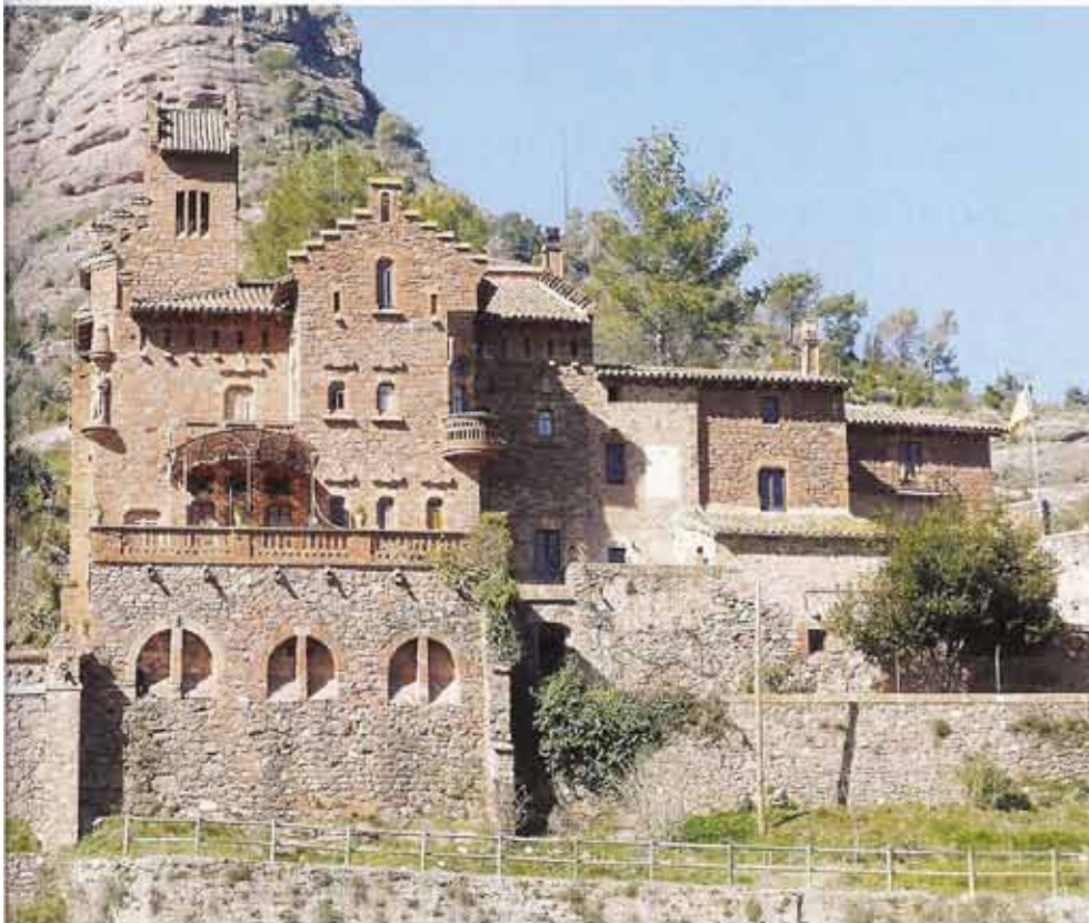
Joan Oliver recordava les nits serenes i les seves felices estades al Marquet de les Roques (Sant Llorenç Savall) a les pàgines de Temps i records .

en va escriure una prosa molt bonica –recorda Soldevila–. De mica en mica amb aquest treball l'adones d'aquesta mena de nuclis de força creativa que tenim estesos per tot el país.» Ho diu algú que ha trepitjat el territori de cap a cap. «Aquest treball m'ha aportat una cosa que és impagable, que és refermar-me en la co-