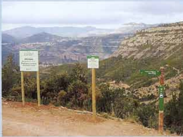
La zona de Montmany (el Figeró), presidida pels cingles de Bertí, van servir d'inspiració a Raimon Casellas per situar la seva novel·la Els sots feréstecs . «A Sant Pau de Montmany un dia hi va arribar mossèn Uätzer...»