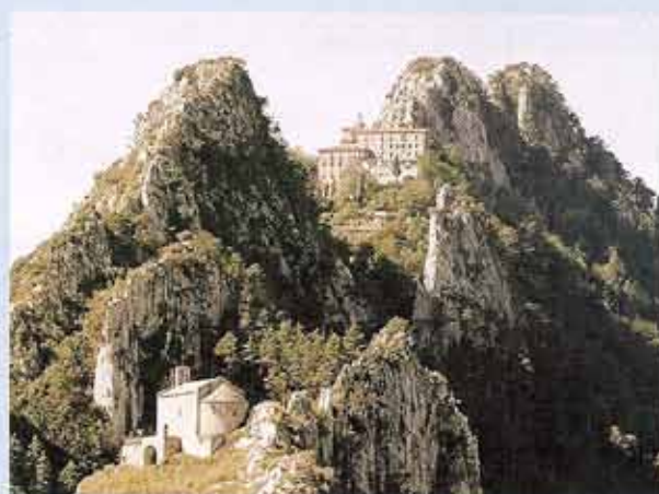
«El santuari de Queralt és un niu d'àguila, aferrat al cim rocallós». L'escriptor mallorquí Baltasar Porcel definia així aquesta talaia que ofereix una bona vista del Berguedà, a la seva obra Canins i ombres (1977).