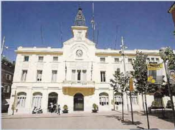
Josep Vallverdú va descriure l'ajuntament de Sant Sadurn d'Anoia així: «Realment l'únic element que ens hi sobra és l'estranya torre metàl·lica, autèntica gàbia que enclou un joc de campanes.» Visions de Catalunya (1973).