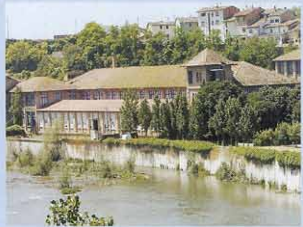
La indústria de Tecla Sala e Hijos, popularment coneguda com La Blava i on va treballar Miquel Martí i Pol durant gairebé 30 anys, va originar diversos poemes del llibre del poeta rodenc La fàbrica (1970-1971) .