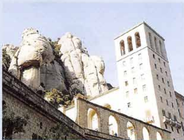
Josep M. de Sagarra, autor d' El poema de Montserrat , va dedicar 10.000 versos a aquest monestir bagenc, símbol de Catalunya. «I Montserrat prou és una lliçó / i fa mil anys que us va donant l'exemple», va escriure.