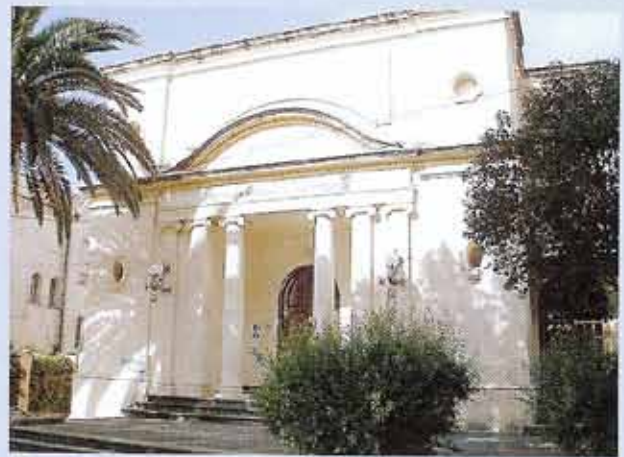
«És un edifici bonic, que evoca un temple neoclàssic, polit, endreçat, com escau a l'esperit noucentista.» M. Aurelia Capmany evocava amb aquestes paraules la biblioteca de Canet de Mar a l'obra Maia memòria (1987).